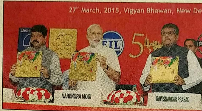
नई दिल्ली में ऊर्जा संगम 2015 में ओएनजीसी विदेश के इतिहास पर पुस्तिका जारी करते प्रधानमंत्री नरेन्द्र मोदी, केन्द्रीय मंत्री रविशंकर प्रसाद और धर्मेन्द्र प्रधान।

नई दिल्ली, (वार्ता): प्रधानमंत्री नरेन्द्र मोदी ने सामर्थ्यवान लोगों से रसोई गैस सब्सिडी छोड़ने की अपील करते हुए उम्मीद जताई की देश 2022 तक ऊर्जा आयात पर 10 प्रतिशत निर्भरता कम करने में सफल होगा। श्री मोदी ने विज्ञान भवन में 'ऊर्जा संगम 2015' के उद्घाटन सत्र को संबोधित करते हुए कहा कि मैं देश के उन लोगों से अपील करता हूँ जो अपनी जेब से बाजार मूल्य पर रसोई गैस खरीदने में सक्षम हैं वे इसकी सब्सिडी नहीं लें। उन्होंने इस मौके पर रसोई गैस छोड़ने के लिए 'गिव अप' अभियान की शुरुआत भी की। उन्होंने कहा कि कुछ समय पहले संसद में जब सरकार ने अमीर लोगों से रसोई गैस की सब्सिडी छोड़ने का आग्रह किया था उस वक्त इसको बहुत तवज्जो नहीं दी गई थी लेकिन लोगों ने इसको काफी समर्थन दिया।